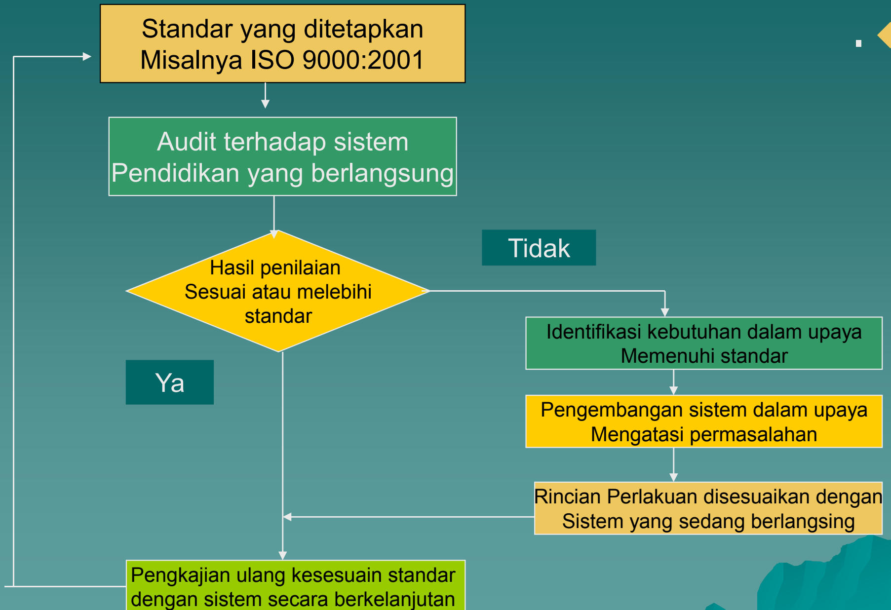
Diagram Alur Penjaminan Mutu